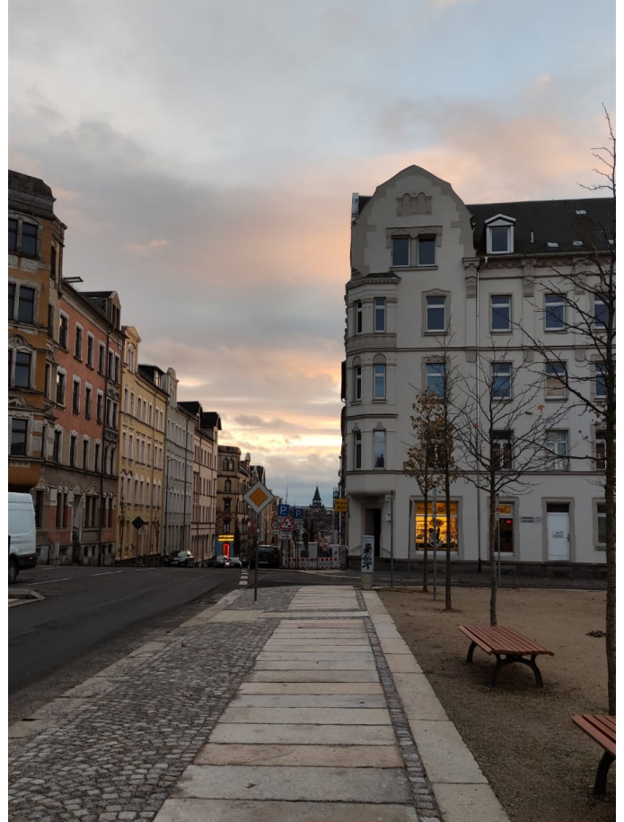
Sonnenberg am Abend