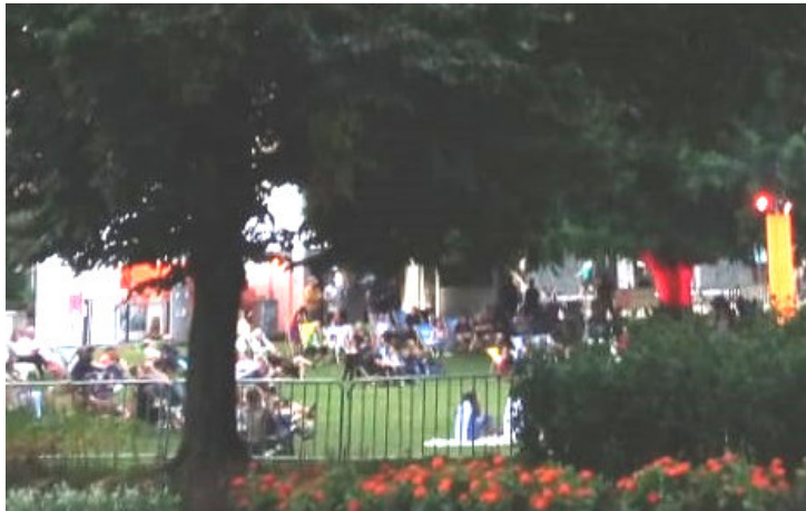
Das Kulturfestival «Parksommer» im Stadthallenpark

In diesem Jahr dürfen gleichzeitig maximal 999 Personen anwesend sein. Dies bedeutet, dass der Parksommer nicht zu den Großveranstaltungen zählt. Deshalb gibt es keine Pflicht vor dem Besuch sich testen zu lassen. Die Organisatoren bitten, die Mindestabstände einzuhalten. Masken sind nicht erforderlich, aber empfehlenswert.