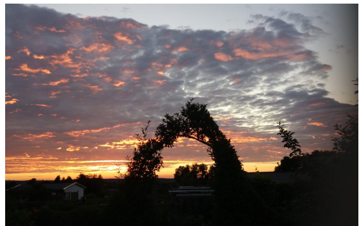
Sommersonnenuntergang in Chemnitz